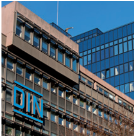
Das Deutsche Institut für Normung in Berlin The German Institute for Standardisation in Berlin