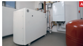
Mini-KWK-Anlage Mini-CHP system

Anmerkung: neuer Brennwertkessel in Systemhaus nicht dargestellt Note: new condensing boiler not pictured in system house