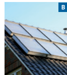
Solare Trinkwassererwärmung und Heizungsunterstützung. Solar thermal system for domestic hot water and heating purposes