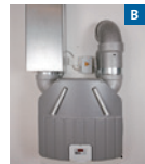
Kontrollierte Wohnungslüftung mit Wärmerückgewinnung Controlled apartment ventilation with heat recovery