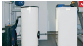
Moderner Gas-/Öl-Brennwertkessel Modern gas/oil condensing boiler