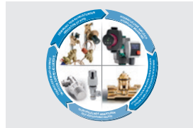
Einflussfaktoren für effiziente Wärmeverteilung Influencing factors for efficient heat distribution