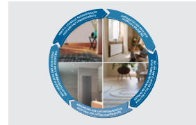
Einflussfaktoren für effiziente Wärmeübergabe Influencing factors for efficient heat transfer