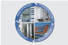
Zusammenspiel Wärmeerzeugung und -speicherung Interaction between heat generation and storage