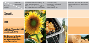
Mögliche Rohstoffe für flüssige Biobrennstoffe Possible feedstocks for liquid biofuels