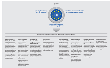
Rahmenbedingungen für den EU-Wärmemarkt Framework conditions for the EU heat market