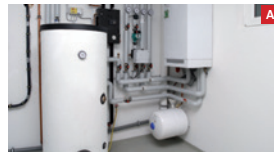
Moderner Gas-Brennwertkessel Modern gas condensing boiler